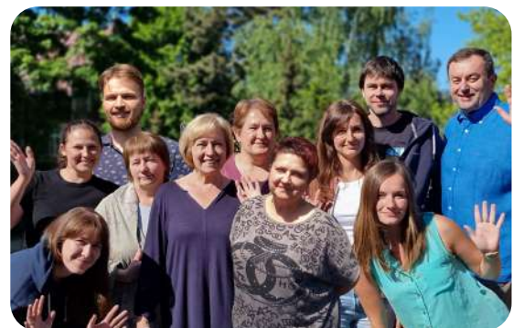
Pracownicy i wolontariusze biura Adopcji Serca w Gdańsku.

Szczegółowe informacje na temat wpływów i wydatków przedstawiliśmy w załącznikach do „Podsumowania działalności 2025” dostępnych na naszej stronie internetowej.