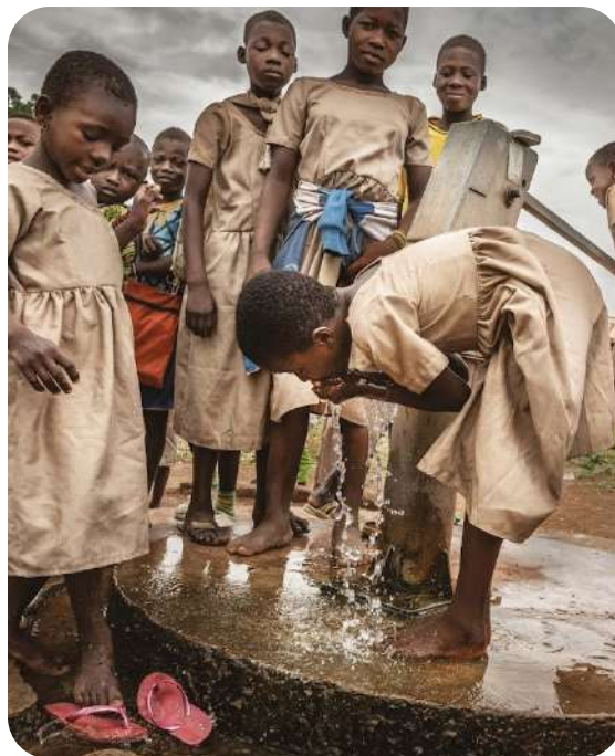
INNE WYDATKI NA PROJEKTY BEZ PODZIAŁU NA KRAJE: 136 250 PLN