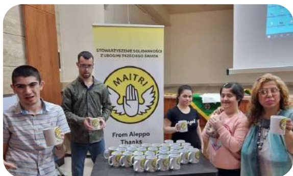
Akcja pomocowa przy parafii św. Franciszka w Aleppo.