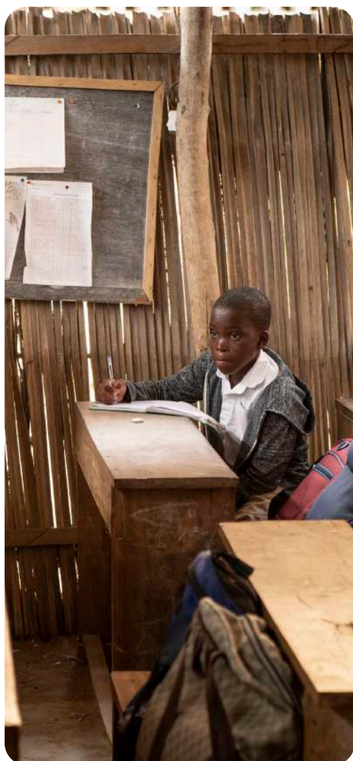
Edukacja to najtrwalsza forma pomocy.