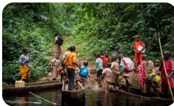
Do szkoły w Essengu dzieci docierają tradycyjnymi czółnami.