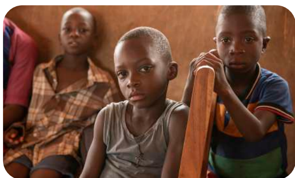
Podopieczni Adopcji Serca z sierocińca w Pagouda.