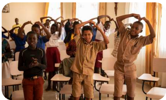
Podopieczni Adopcji Serca z Kabgayi.

Zgromadzenie Sióstr Pallotynek prowincji Rwanda-Kongo-Uganda