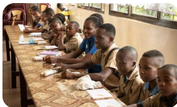
Spotkanie na temat Adopcji Serca w misji Sióstr Józefitek w Brazzaville.