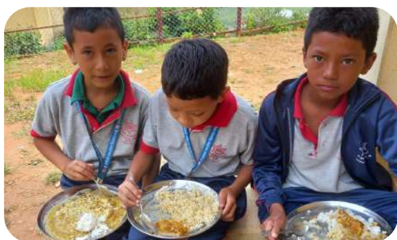
Dożywianie dzieci w ośrodku Dashinkali, koszt posiłku to ok. 2 zł.