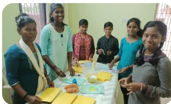
Podopieczni Adopcji Serca z Puri przygotowują listy do wysyłki do swoich Ofiarodawców.