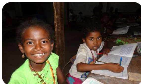
Madagaskar to ostatni z krajów, w którym uruchomiliśmy program Adopcji Serca.