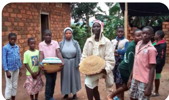
W Ugandzie podopieczni Adopcji Serca otrzymują część wsparcia w postaci produktów żywnościowych.

Zgromadzenie Sióstr Pallotynek prowincji Rwanda-kongo-Uganda