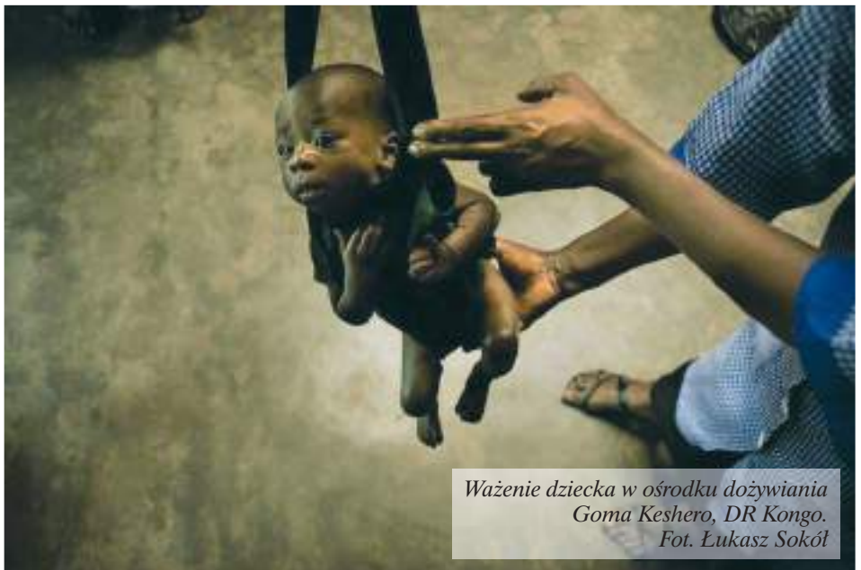
Ważenie dziecka w ośrodku dożywiania Goma Keshero, DR Kongo.