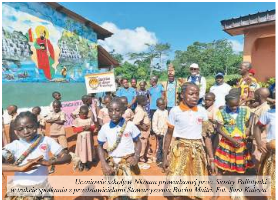
Uczniowie szkoły w Nkoum prowadzonej przez Siostry Pallotynki w trakcie spotkania z przedstawicielami Stowarzyszenia Ruchu Maitri.

Poprzez ten list dziękuję każdemu, kto pomaga naszym maluchom w ich codziennym dożywianiu w przedszkolu. Dziękuję