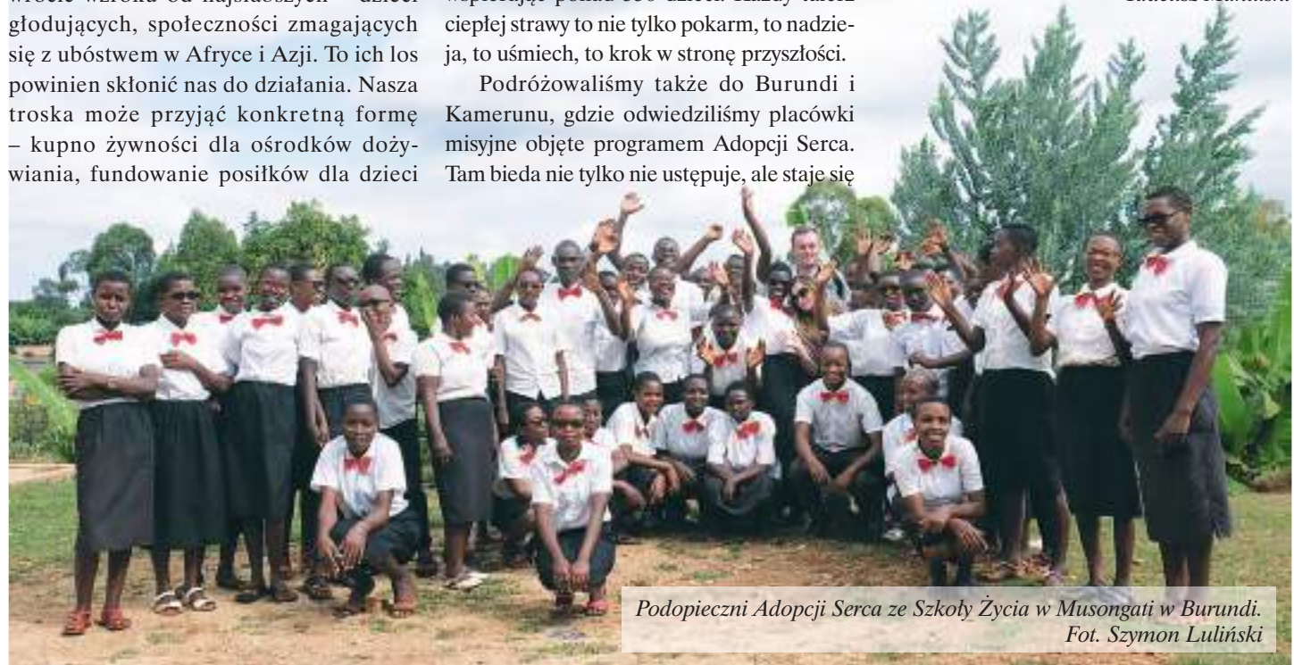
Podopieczni Adopcji Serca ze Szkoły Życia w Musongati w Burundi.