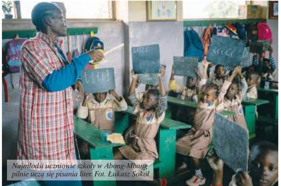
Najmłodszy uczniowie szkoły w Abong-Mbang pilnie uczą się pisania liter.